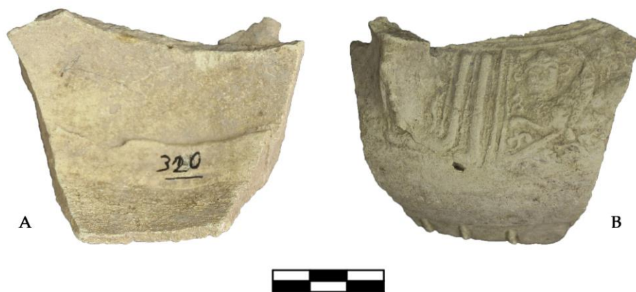
Fig. 4 - Frammento di moulded relief ware : a) superficie interna; b) superficie esterna con decorazione a rilievo realizzata con la tecnica della modellazione a matrice.