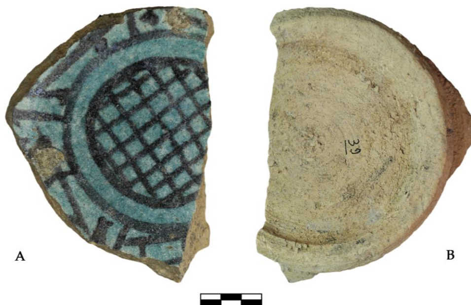
Fig. 5 - Frammento di unglazed black painted ware : a) superficie interna con decorazione dipinta in nero sotto vetrina turchese; b) superficie esterna.