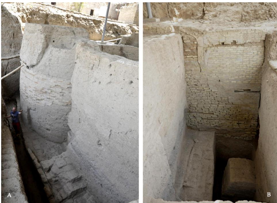
Fig. 2 - Lo scavo dell'Area E: a) la trincea principale; b) l'estensione occidentale.