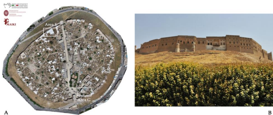
Fig. 1 - La Cittadella di Erbil: a) ortofoto della Cittadella con indicazione delle aree di scavo (ortofoto L. Ebanista-MAIKI, 2019); b) vista da ovest (foto J. Bogdani-MAIKI, 2012).