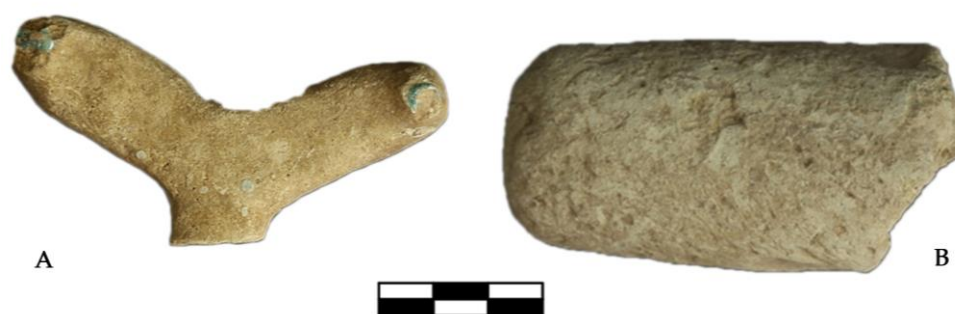
Fig. 6 - a) Frammento di distanziatore con gocce di vetrina ( trivet ); b) frammento di barra di fornace ( kiln peg ).