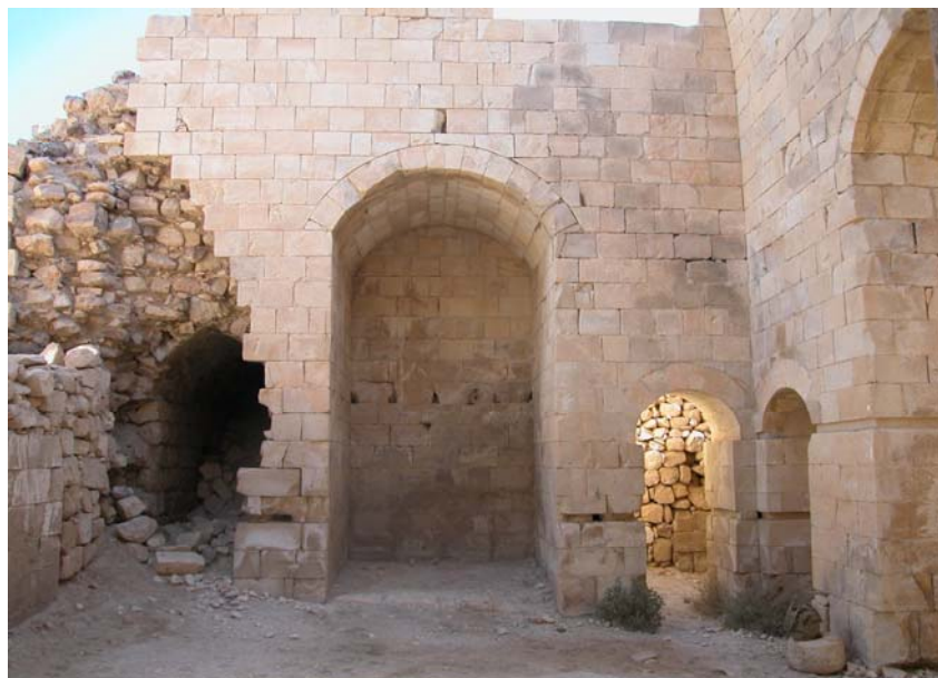
Fig. 4: UF3, il lato nord. Al centro l' iwān , ai lati i passaggi ad arco verso i corridoi UF8 e UF9 (Progetto Shawbak, foto Rugiadi 2007).