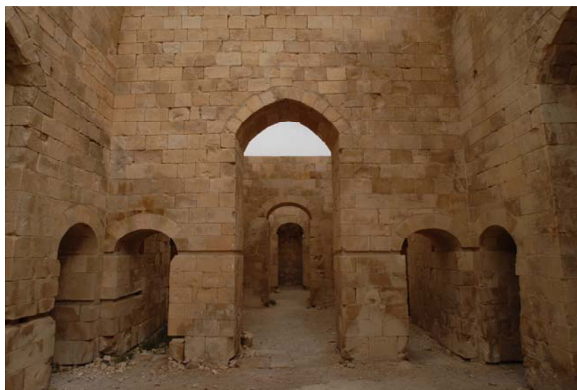
Fig. 3: UF3, la cortina tripartita verso UF2. Attraverso l'arco centrale sono visibili quello in UF2 e la nicchia di fondo nell'ambiente UF1 (Progetto Shawbak, foto Missione archeologica Università di Firenze).