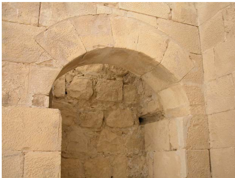
Fig. 7: UF1, una delle nicchie (Progetto Shawbak).