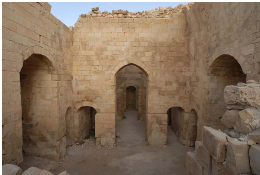
Fig. 2: La sala principale UF3, con i due t̄wān . Al centro, la cortina tripartita verso l'ambiente UF2, visibile attraverso l'arco centrale (Progetto Shawbak, foto Missione archeologica Università di Firenze).