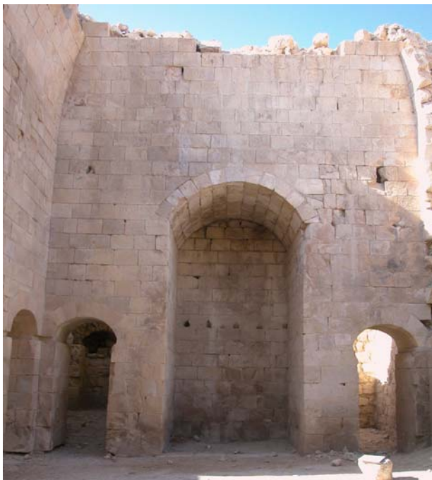
Fig. 5: UF3, il lato sud. Al centro l' iwān , ai lati i passaggi ad arco verso l'ambiente UF6 e il corridoio UF7 (Progetto Shawbak, foto Rugiadi 2007).