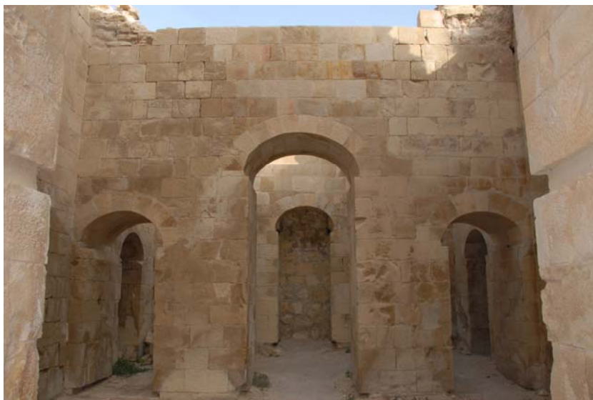
Fig. 6: UF2, la cortina tripartita est verso UF1. Attraverso l'arco centrale è visibile la nicchia di fondo in UF1; attraverso gli archi laterali sono visibili rispettivamente, sempre in UF1, la nicchia nord e l'arco sud (Progetto Shawbak, foto Missione archeologica Università di Firenze).