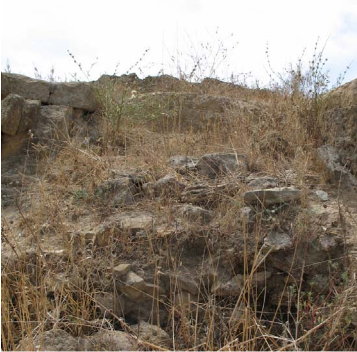
Fig. 5. Selinunte, Gaggera: la massicciata all'interno dell'altare, da nord.