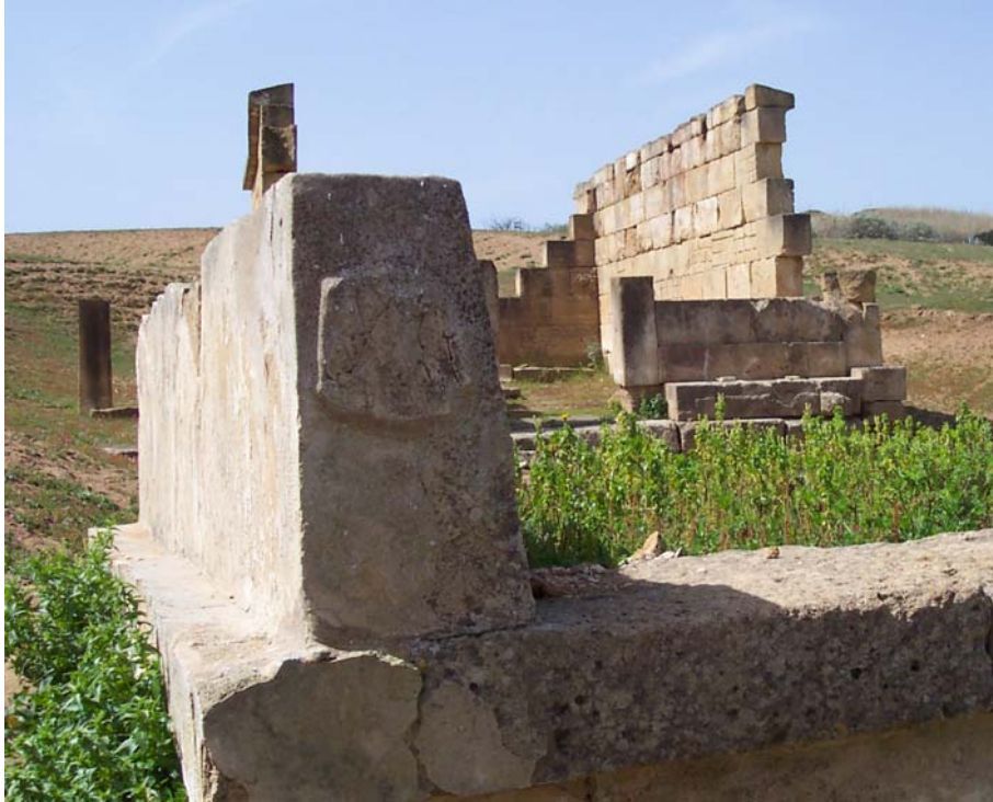
Fig. 7. Selinunte, Gaggera: betilo posto all'estremità meridionale dell'altare, da sud-est.