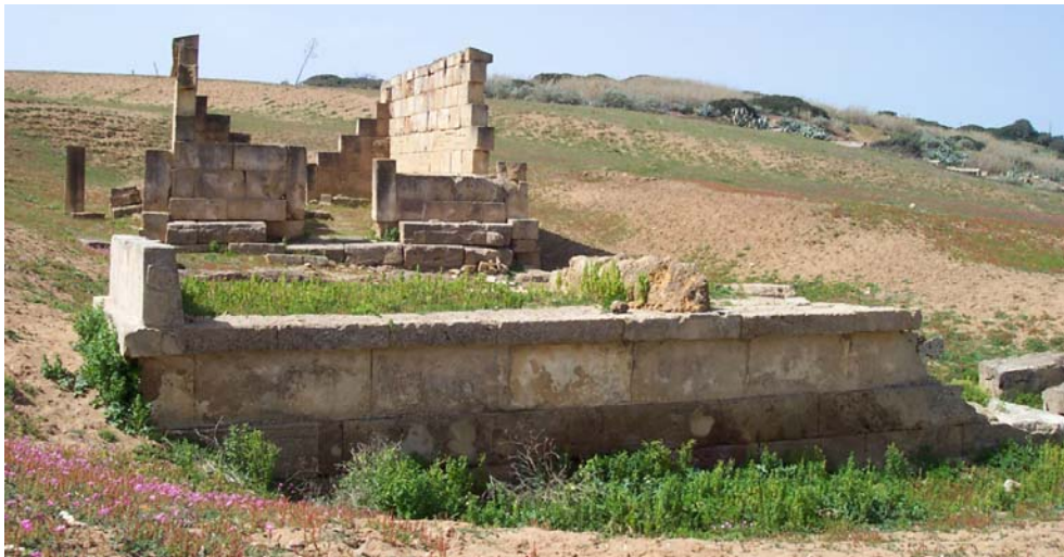
Fig. 2. Selinunte, Gaggera: altare a tre betili antistante l'edificio "Triolo Nord", da est.