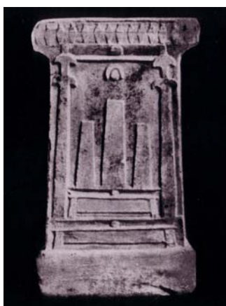
Fig. 11. Stele con altare a tre betili da Cartagine (Bisi 1967, tav. VI, 1).