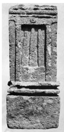
Fig. 12. Stele con altare a tre betili da Mozia (Moscati - Uberti 1981, tav. CVII, 677).