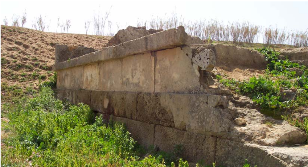
Fig. 6. Selinunte, Gaggera: lato orientale dell'altare (tracce di intonaco sul secondo filare), da nord-est.