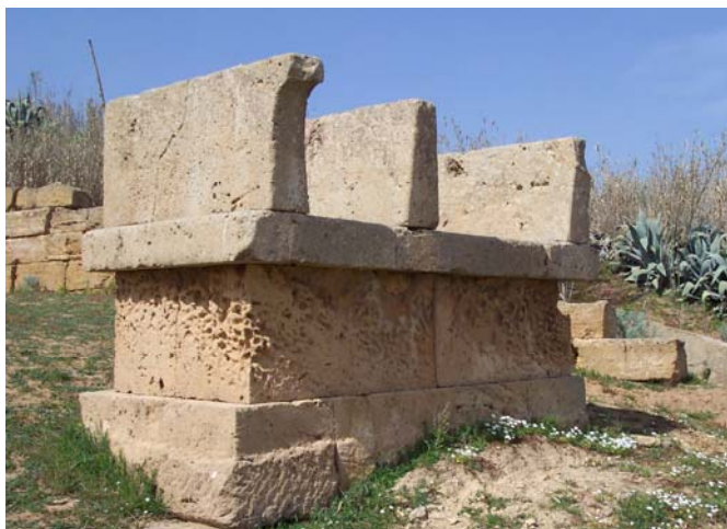
Fig. 9. Selinunte, Gaggera: altare a tre betili ad ovest del tempietto del Meilichios, da sud-est.