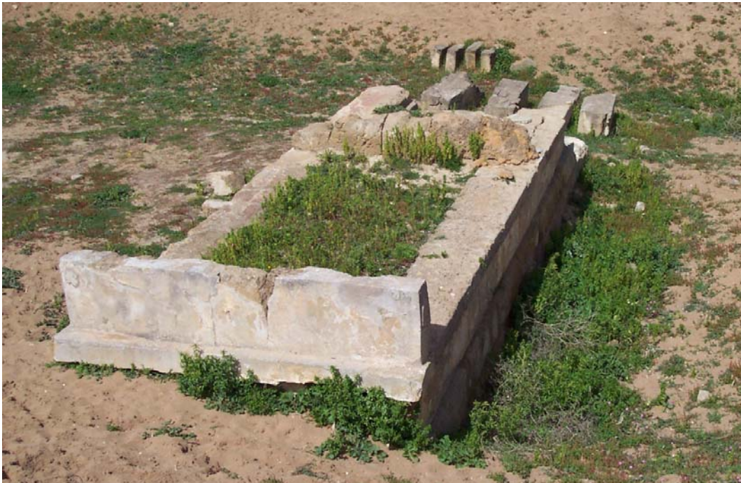
Fig. 4. Selinunte, Gaggera: altare a tre betili antistante l'edificio "Triolo Nord", da sud-est.