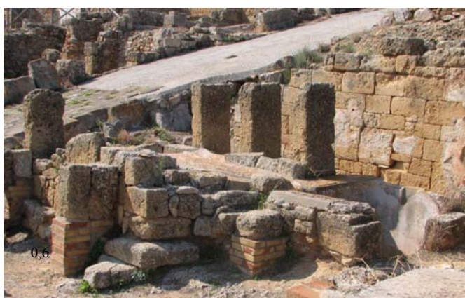
Fig. 10. Solunto, Area sacra: altare a tre betili, da nord est.