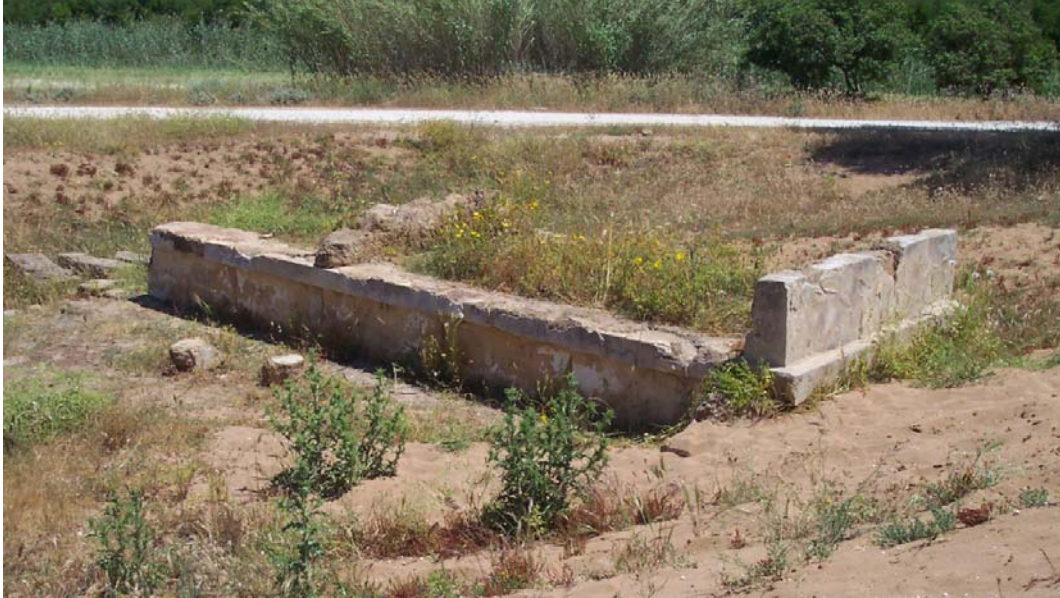
Fig. 3. Selinunte, Gaggera: altare a tre betili antistante l'edificio "Triolo Nord", da sud-ovest.